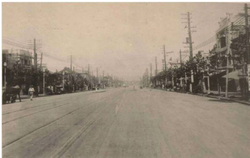
神奈川県警察署付近から東京方面を撮影