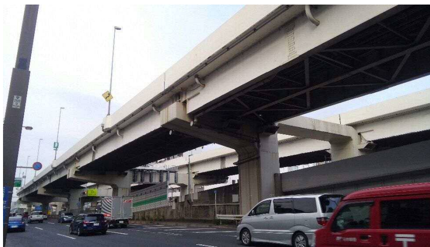
神奈川警察署付近から東京方面を撮影